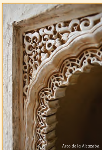
Arco de la Alcazaba.

Seit geraumer Vorzeit erreichten über das Mittelmeer zahlreiche Völker, Religionen und Kulturen den Süden Spaniens. Punier, Römer und Hebräer hinterließen ihre nachhaltigen Spuren, aber zweifellos wird unsere größte Aufmerksamkeit von der arabischen Zivilisation geweckt, von ihren großen Metropolen, ihren herrlichen Monumenten und von dem fruchtbaren Einfluss, den sie auf die Kultur der Christen ausgeübt hat. Nur so erklären sich die Dörfer, die Kunst, die Gesellschaft und die Landschaften des heutigen Andalusien.