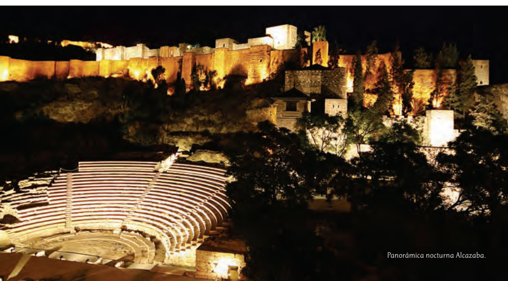
Panorámica nocturna Alcazaba.

Nach dem Frühstück treten wir die Heimreise an, das Gepäck voll schöner Erinnerungen und Erlebnisse.