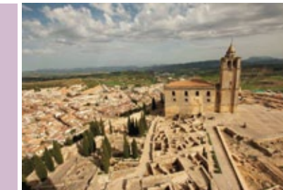
Alcalá la Real