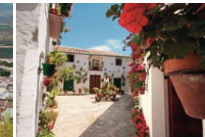
Priego de Córdoba